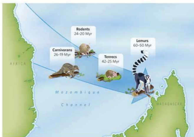
Figure 3 : L'hypothèse dite du rafting (Krause, Nature 2010). Dans cette hypothèse, la traversée des plus de 450 km qui séparent l'île de Madagascar de l'Afrique s'effectue sur des radeaux, morceaux de terre et/ou d'arbre arrachés du continent africain lors de fortes (et sporadiques) tempêtes.