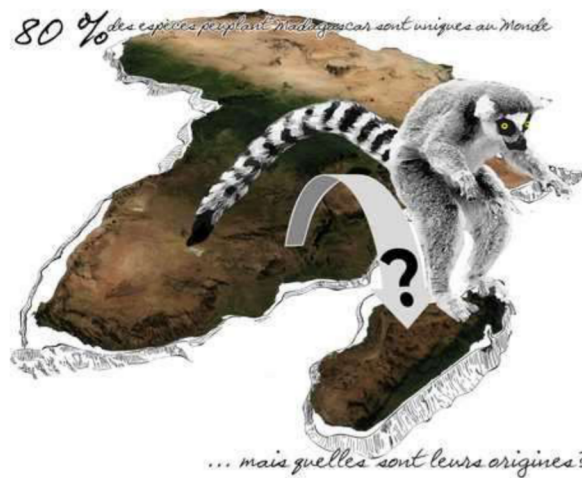
Figure 2 : 80% des espèces vivant sur Madagascar sont uniques au Monde. Comment sont-elles arrivées sur l'île ?